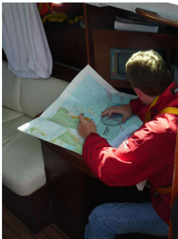
Toch even nakijken

Vrijdagmorgen wordt de overtocht naar Blankenberge gepland: 90 mijl. Er wordt een ovenschotel voorbereid en de wachten worden ingedeeld. Ik probeer gewoonlijk een handige cursist en een intellectueel samen te zetten maar deze keer zijn het allemaal slimmeriken... Thames Coastguard voorspelt SW tot W wat dus ruime wind betekent, eindelijk... tot ongeveer 1 minuut voor het vertrek de wind plots aanwakkert en naar het SE krimpt..... Bij het vertrek zie ik dat onze cursisten het er goed vanaf brengen in vergelijking met veel andere schippers. Dat dagje havenmaneuvers is niet voor niets geweest. De eerste uren wordt het opkruisen maar in de omgeving van de Outer Gabbard vindt ook de wind dat het nu goed is geweest en ruimt hij net genoeg om bij de wind naar Blankenberge te kunnen zeilen. Als instructeur moet je nu vertrouwen in de cursisten die je 7 dagen onder je hoede hebt en die het parkoers van de zeezeilschool doorlopen hebben.... de echte test.